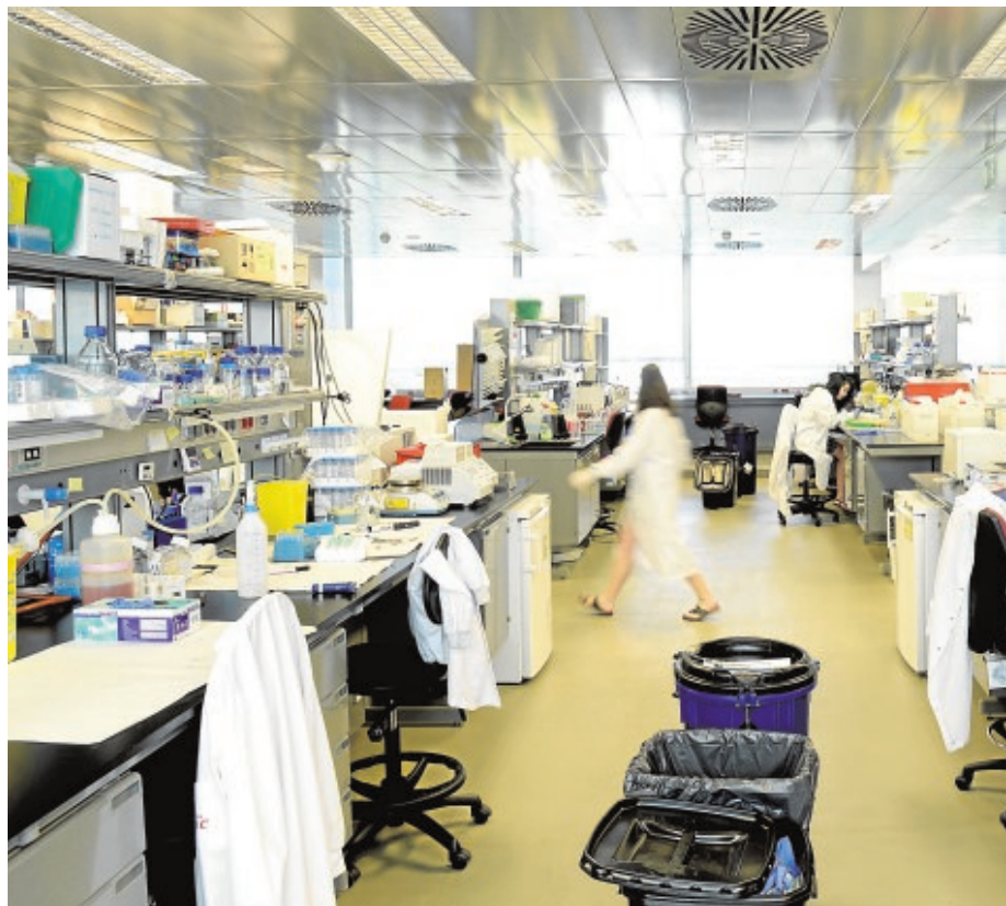
El centro ha fusionado la labor de investigadores básicos con clínicos