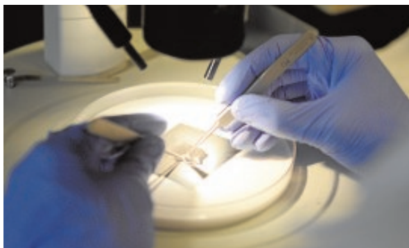
Un investigador estudia el corazón de un ratón